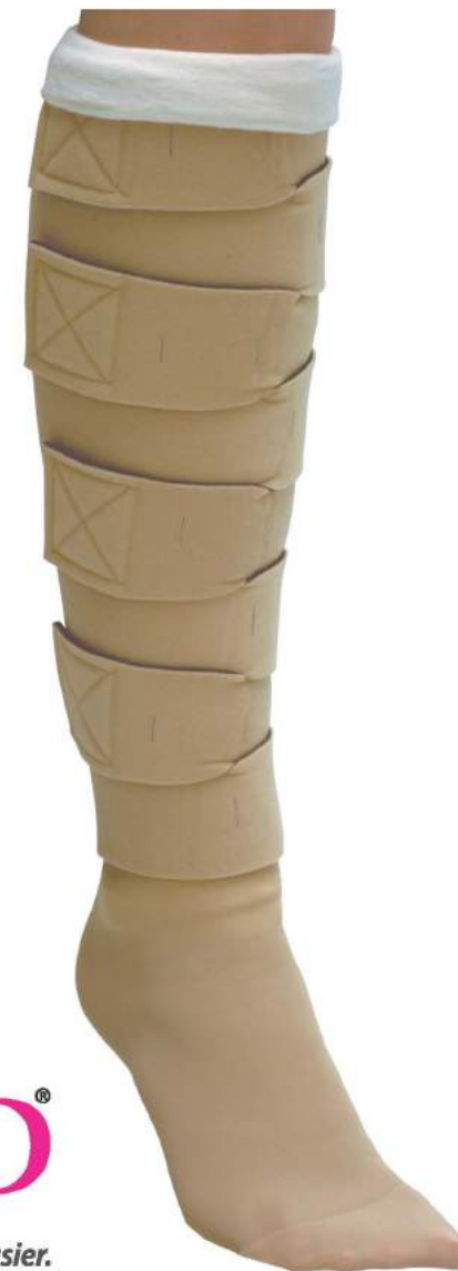
◀ Aspect final

Si une assistance supplémentaire est nécessaire, s'il vous plaît contacter le service client par téléphone au 1-800-361-3153 ou par courriel service@valco.ca . Lorsque les bandes sont placées dans une position parallèle, ils doivent se chevaucher légèrement, sans laisser d'espace entre les bandes.